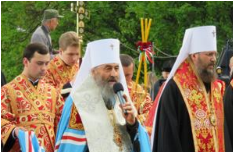
Metropolitan Onufry (Berezovskyy), Kyiv, 8 May 2016

Finally, the concept of a religious "expert examination" is also vague and legally questionable. Across the post-Soviet region, including in Belarus , occupied Crimea , and Central Asian states such as Kazakhstan , "expert analyses" are often used to justify freedom of religion or belief and other human rights violations, including jailing prisoners of conscience.