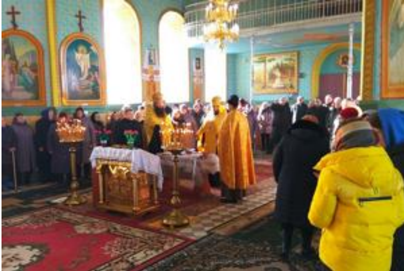
Liturgy in Orthodox Church of Ukraine parish, Stara Pryluka, 1 January 2023